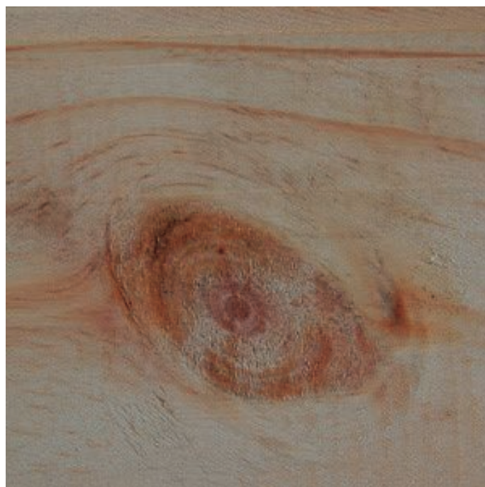
Nudo vivo.

de tijeras que pueden ser manuales o electrónicas y también serruchos. Se han observado mayores rendimientos, por operario, cuando se utilizan tijeras electrónicas. El serrucho, al igual que las tijeras, posee alta calidad en el corte. Sin embargo, se corren mayores riesgos de cometer errores cuando el personal no está entrenado (Kurtz V. D et al. , 2004).