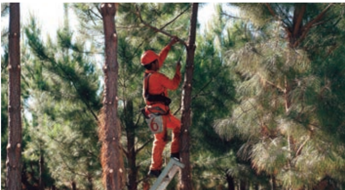
Poda en altura de Pinus sp en la provincia de Corrientes con serrucho y escalera de aluminio.

Con esta práctica no sólo se amplían las posibilidades de obtener mejores precios en el mercado, también se facilita